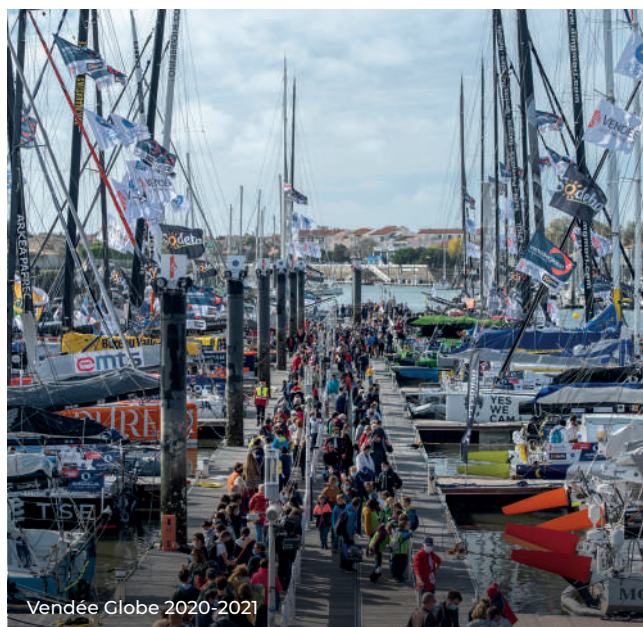
Vendée Globe 2020-2021