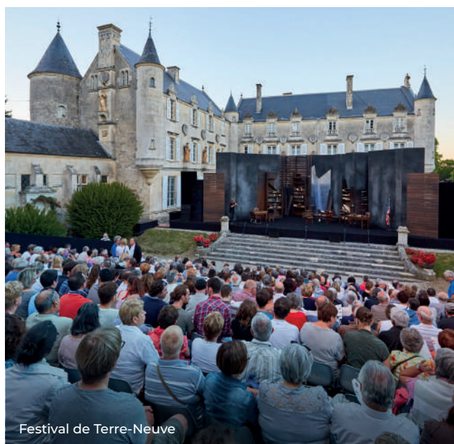
Festival de Terre-Neuve