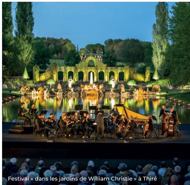
Festival « dans les jardins de William Christie » à Thiré