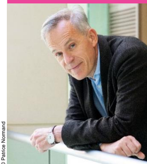
Étienne DE MONTETY

Le 33 e Printemps du Livre de Montaignu se déroulera du 24 au 26 mars 2023. Il sera présidé par le journaliste et romancier Étienne de Montety, lauréat du Grand Prix du Roman de l'Académie française 2020 pour La Grande Épreuve (Stock). Avec plus de 200 auteurs invités dont de nombreux romanciers populaires et plébiscités par le grand public (Virginie Grimaldi, Michel Bussi, Aurélie Valognes, Bernard Werber), le Printemps du livre de Montaignu s'affirme comme étant la première manifestation littéraire en Pays de la Loire.